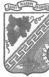
SAINT MARTIN D'ABLOIS